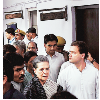
Congress Vice-President Rahul Gandhi (right) was taken into custody along with Sonia Gandhi (second from left), who predicted the government's days were numbered

Congress MPs also attempted to raise the issue in Parliament. When not allowed, they forced two adjournments in the Rajya Sabha with disruptions. Amid the din, party leader Anand Sharma accused the government of "insulting and abusing all Constitutional norms".